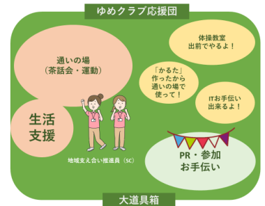
【LINEによる生活支援マッチング】

生活支援の仕組み立ち上げから関わり、「へそのまちお助けサポーター」の創出と育成に関わった。今期は課題を抽出した上で、住民自ら活動のPR活動を行なった。実際の生活支援では先進的な取り組みとしてLINE公式アカウント「脳若365」にてマッチングを行っている。案件依頼をサポート限定で配信し、カスタマーセンターにてマッチングする。マッチング作業も固定メンバーにならないよう配慮し、細やかなサポートを行なった。