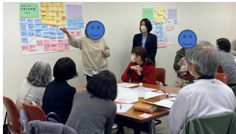
最終回 グループワークの様子