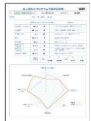
個人へのフィードバック