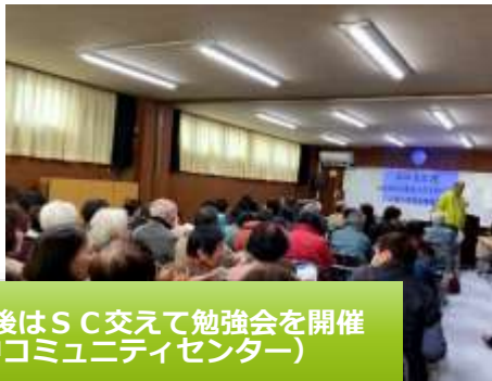
毎年恒例開催。講演後はSC交えて勉強会を開催 (岐阜羽島市上中コミュニティセンター)