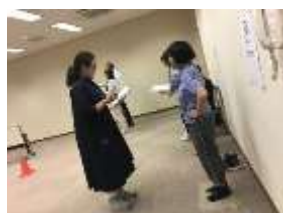
測定の様子（片脚立位時間）

個人へのフィードバック結果お渡しと協力研究機関である広島大学より研究報告書を受領。