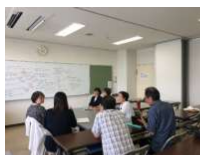
6/28 生活部（訪問B）情報交換会